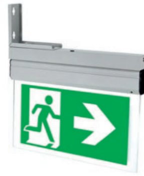
Wspornik flagowy / Flag mounting bracket