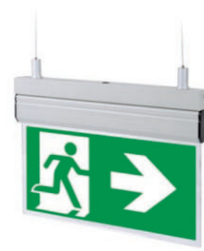
Zestaw do montażu zwieszanego / Suspended mounting kit