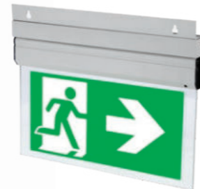
Wspornik ścienny / Wall mounting bracket