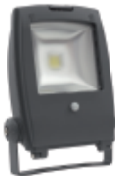
RINDO MCOB-30-GM SE