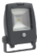
RINDO MCOB-10-GM SE