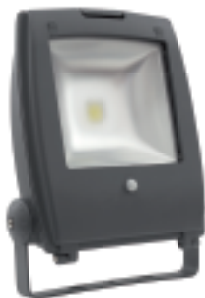
RINDO MCOB-50-GM SE

RINDO MCOB-10-GM SE - 145 RINDO MCOB-30-GM SE - 220 RINDO MCOB-50-GM SE - 295