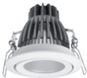
DAGO LED MCOB DLP-10