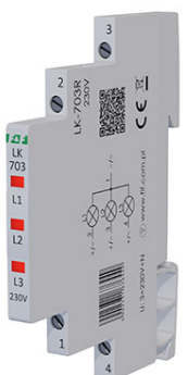
LK-703R-230V 3 x czerwony 3×230 V+N Pobierz