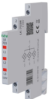
LK-703R-110V 3 x czerwony 3×110 V+N Pobierz