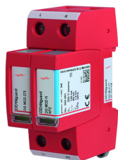
Ilustracje nie są wiążące