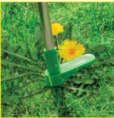
Wcisnąć bronę chwastownik w ziemię

Aby uzyskać najlepsze rezultaty, zwilż glebę przed użyciem brony chwastownika z długim uchwytem.