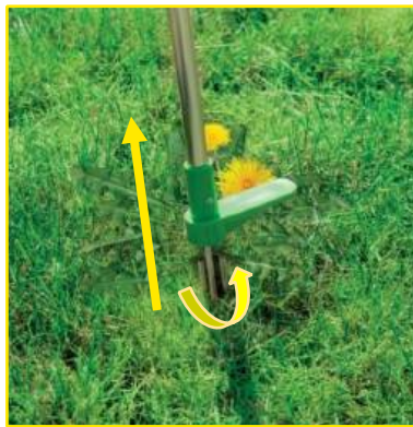
Przekręć chwastownik, aby go chwycić, a następnie podnieść