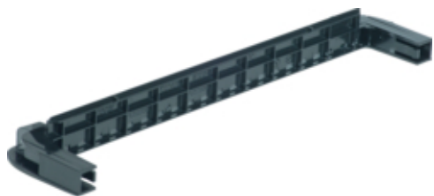
Nośnik samozacisków do rozdzielnic VB, FD, FU