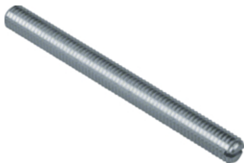
tehalit.BK Śruba M8x85 BK