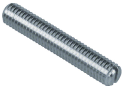
tehalit.BK Śruba M8x45 BK