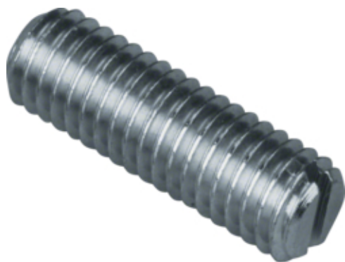
tehalit.BK Śruba M8x35 BK