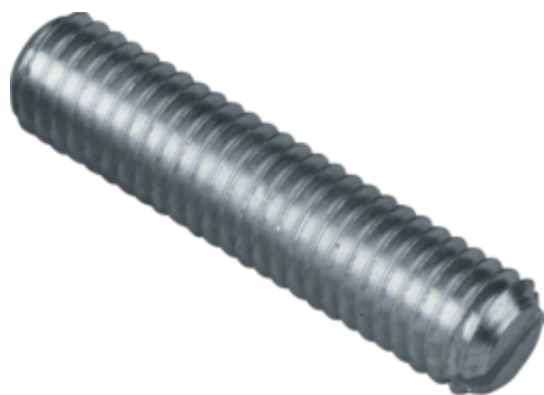
tehalit.BK Śruba M8x25 BK