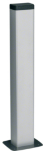
tehalit.DA200 Minikolumna jednostronna DA200-80 H=650mm alu