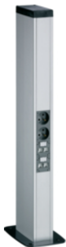
tehalit.DA200 Minikolumna dwustronna DA200-45 H=650mm alu