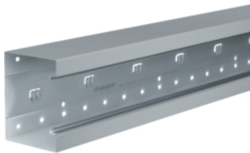
tehalit.BRS Podstawa 100x130mm stal ocynk