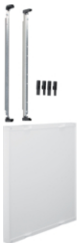
univers N Blok pusty 600x500mm