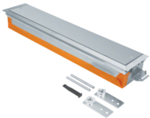
tehalit.BK Końcówka kanału wanna stalowa BKW 600x(80-120)mm stal