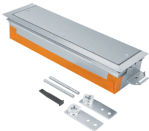
tehalit.BK Końcówka kanału wanna stalowa BKW 400x(90-130)mm stal