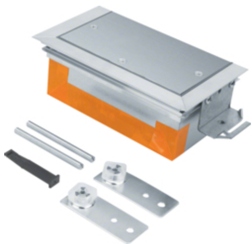
tehalit.BK Końcówka kanału wanna stalowa BKW 200x(90-130)mm stal