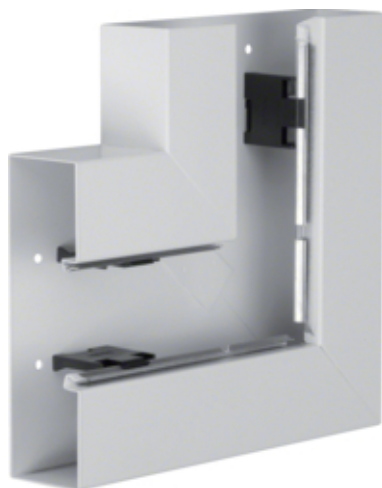
tehalit.BRS Kąt płaski 65x210, stalowy, jasnoszary