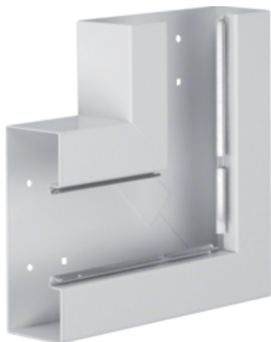
tehalit.BRS Kąt płaski 65x170, stalowy, jasnoszary