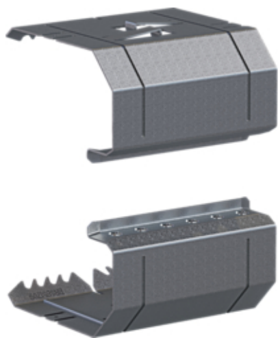
tehalit.BRS Łącznik podstawy 85x170