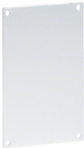
tehalit.BRAP Końcówka 65x100mm anodyzowany