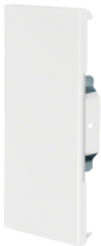
tehalit.BRS Końcówka 85x170 ocynk