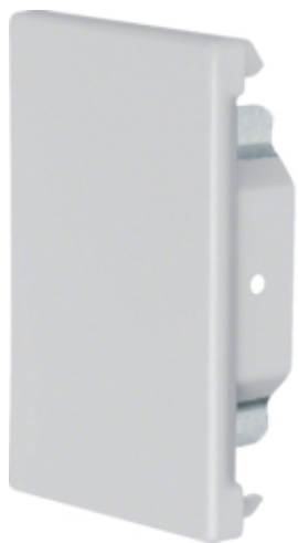
tehalit.BRS Końcówka 65x100, jasnoszary