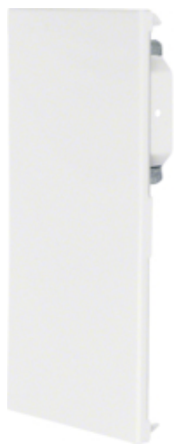
tehalit.BRS Końcówka 100x210 D ocynk