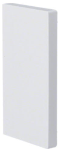
tehalit.BRP Końcówka 65x130, biały