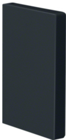
tehalit.BRP Końcówka 65x100, czarny