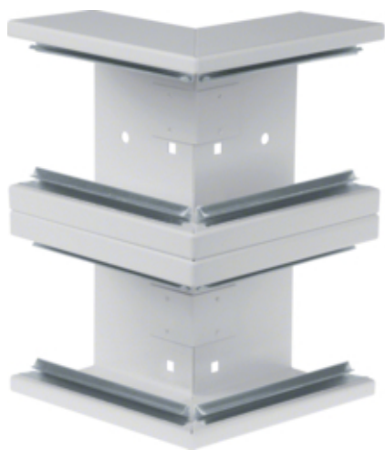
tehalit.BRS Kąt zewnętrzny 65x210 D, stalowy, jasnoszary