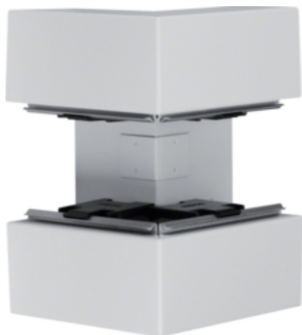
tehalit.BRS Kąt zewnętrzny 65x210 stalowy, jasnoszary