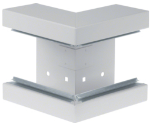
tehalit.BRS Kąt zewnętrzny 65x130, stalowy, jasnoszary