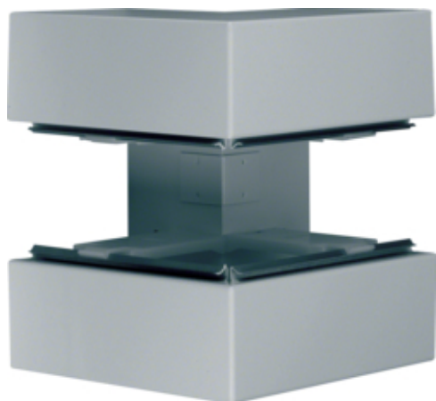
tehalit.BRS Kąt zewnętrzny 100x210 stal ocynk