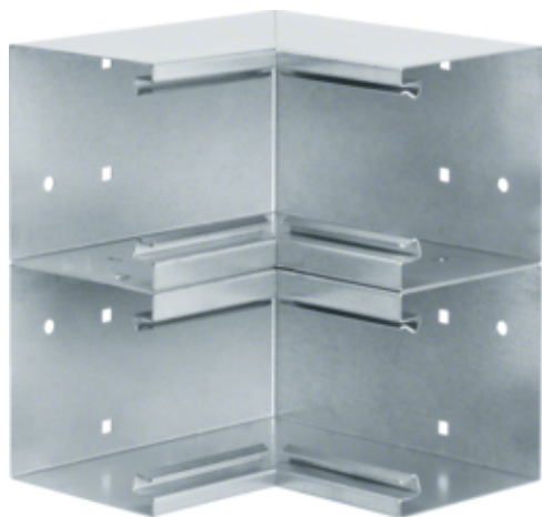
tehalit.BRS Kąt wewnętrzny 100x210 D stal ocynk