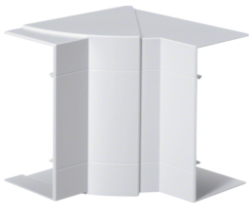
tehalit.BRP/BRAP Kąt wewnętrzny 65x130, biały