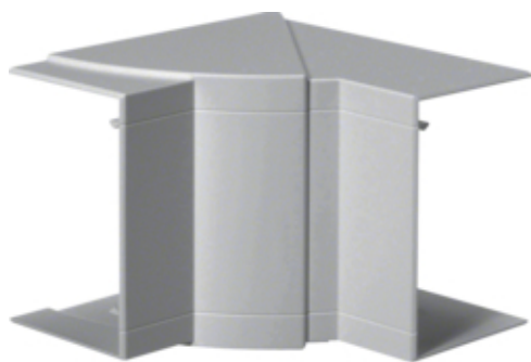
tehalit.BRP/BRAP Kąt wewnętrzny 65x100, lakier alu