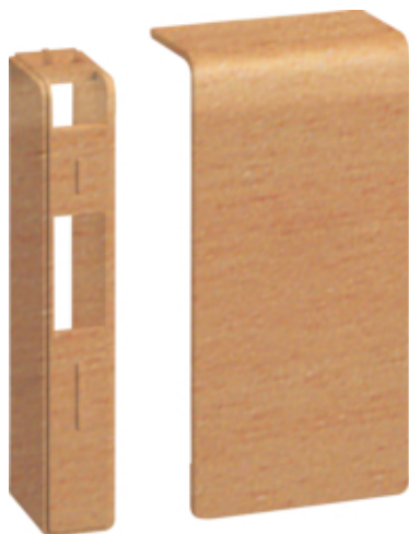
tehalit.SL Końcówka 20x80 buk