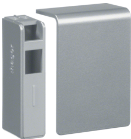
tehalit.SL Końcówka 20x55, aluminium