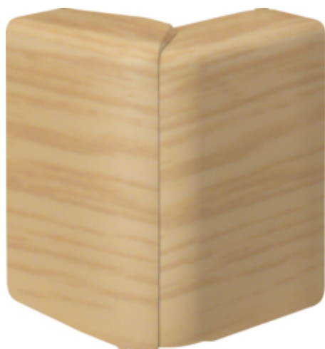
tehalit.SL Kąt zewnętrzny regulowany 20x80 dąb