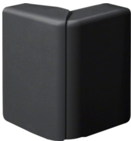
tehalit.SL Kąt zewnętrzny regulowany 20x80 czarny