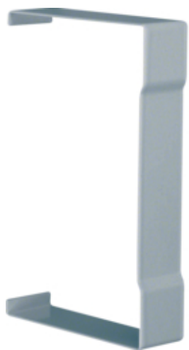
tehalit.BRS Łącznik pokrywy 85x130 ocynk