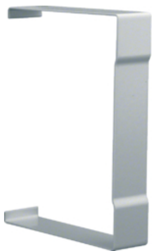
tehalit.BRS Łącznik pokrywy 100x130 stal, ocynk