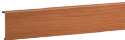
tehalit.SL Pokrywa 20x80 wiśnia