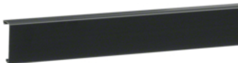
tehalit.SL Pokrywa 20x55 czarny