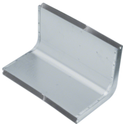
tehalit.UK Narożnik pionowy 2-komorowy 340X28mm stal