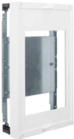
univers N Blok z płytą montażową dla 1xNH1 450x250mm