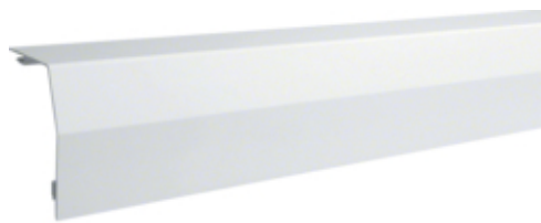
tehalit.RK 110 Pokrywa główna biały