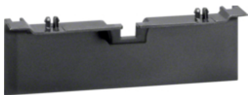
tehalit.SL Maskownica nośnika 20x115 czarny