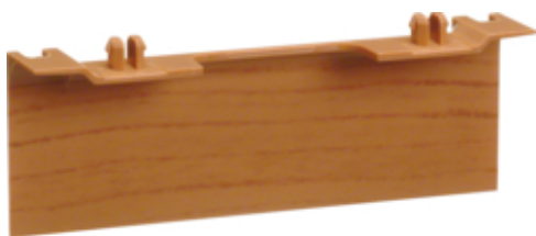
tehalit.SL Maskownica nośnika 20x80 fi60 buk