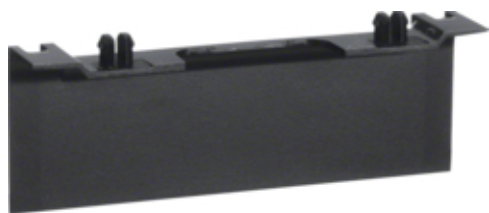
tehalit.SL Maskownica nośnika 20x80 fi60 czarny