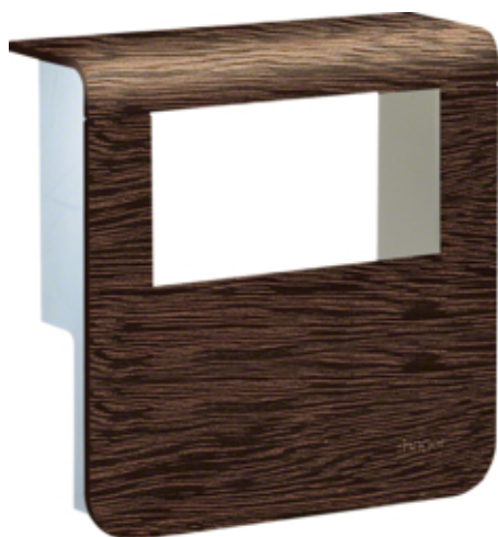
tehalit.SL Pokrywa nośnika urządzeń 20x80 2*45x45 sucupira