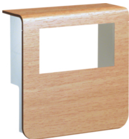
tehalit.SL Pokrywa nośnika urządzeń 20x80 2*45x45 buk